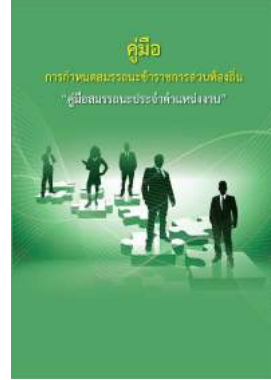
หนังสือ สมรรถนะประจำตำแหน่งงาน