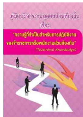
หนังสือ ความรู้ที่จำเป็นสำหรับการปฏิบัติงาน ของข้าราชการหรือพนักงานส่วนท้องถิ่น