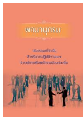
หนังสือ สมรรถนะที่จำเป็นสำหรับการปฏิบัติงานของ ข้าราชการหรือพนักงานส่วนท้องถิ่น