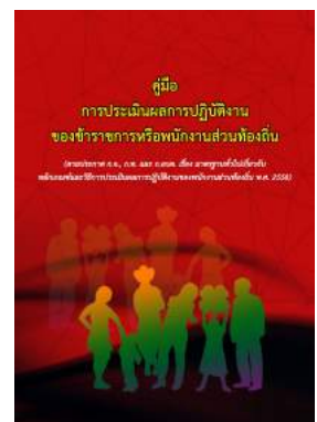
หนังสือ การประเมินผลการปฏิบัติงาน ของข้าราชการหรือพนักงานส่วนท้องถิ่น