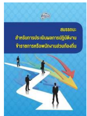
หนังสือ สมรรถนะสำหรับการประเมินผลการปฏิบัติงาน ข้าราชการหรือพนักงานส่วนท้องถิ่น