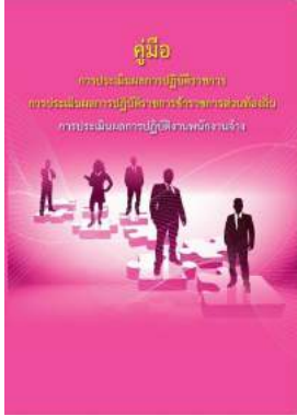
หนังสือ การประเมินผลการปฏิบัติงานพนักงานจ้าง