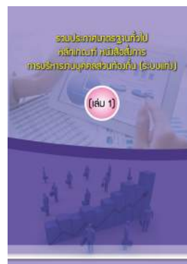
หนังสือ รวมประกาศมาตรฐานทั่วไป หลักเกณฑ์ หนังสือสั่งการ การบริหารงานบุคคลส่วนท้องถิ่น