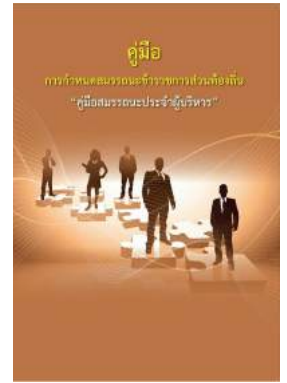
หนังสือ สมรรถนะประจำผู้บริหาร