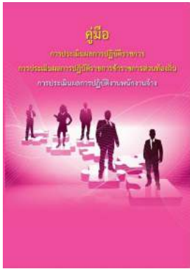
หนังสือ การประเมินผลการปฏิบัติงานพนักงานจ้าง