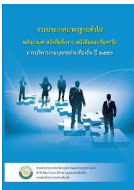
หนังสือ หลักเกณฑ์ หนังสือสั่งการ หนังสือตอบข้อหาหรือ การบริหารงานบุคคลส่วนท้องถิ่น ปี ๒๕๕๗