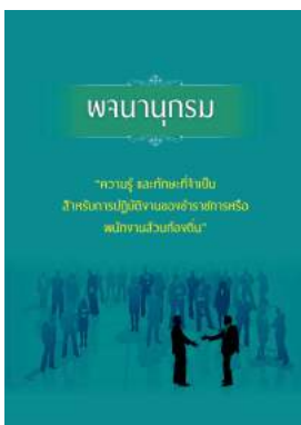
หนังสือ ความรู้ และทักษะที่จำเป็น สำหรับการบริหารปฏิบัติ งานของข้าราชการหรือพนักงานส่วนท้องถิ่น