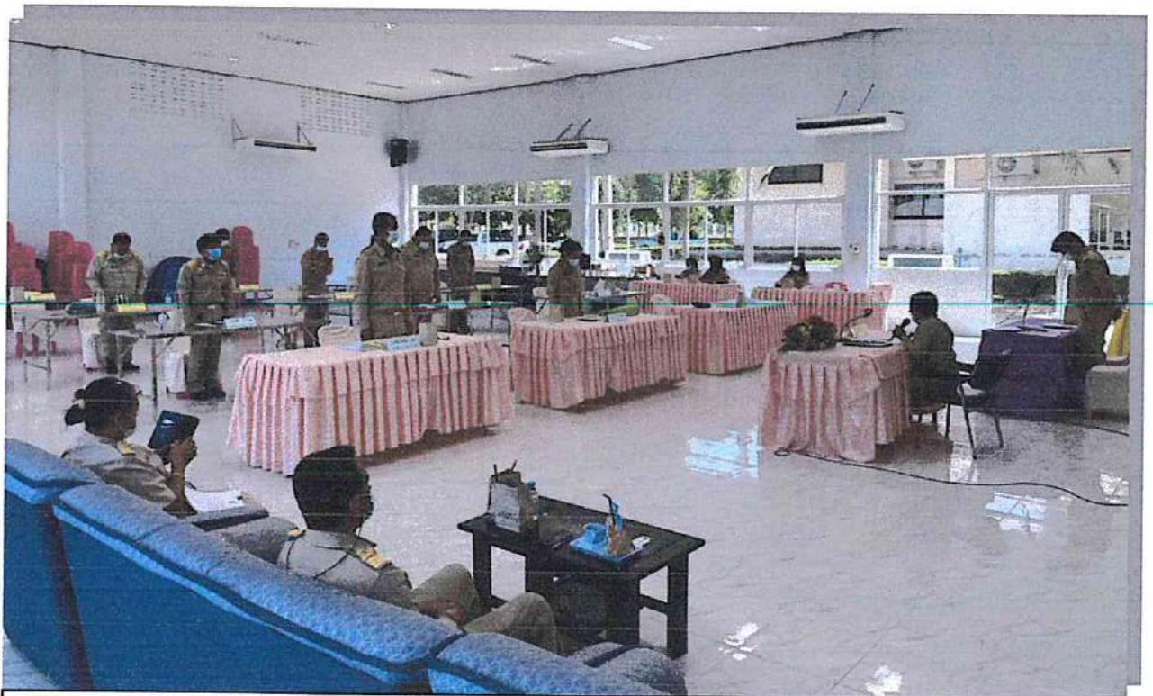
ประธานสภาเทศบาลฯ ชั่วคราว นำสมาชิกสภาเทศบาลตำบลหนองปรือกล่าวคำปฏิญาณตน